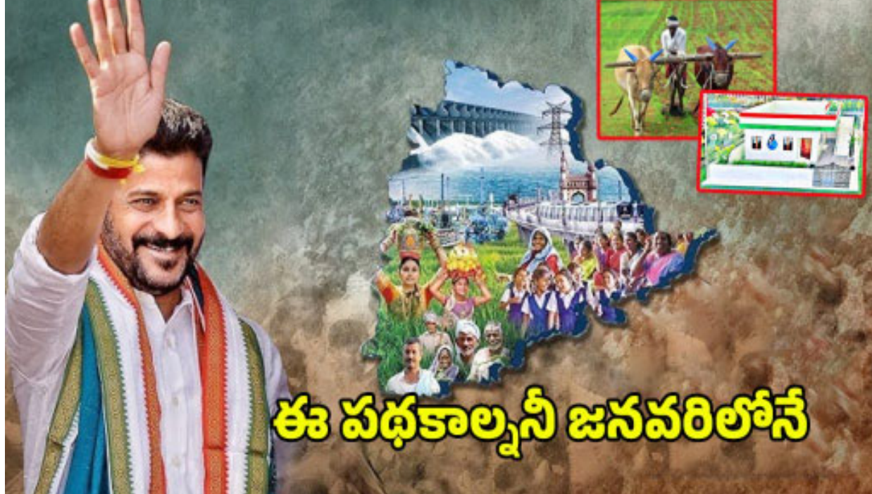
ఈ పథకాలన్నీ జనవరిలోనే

అనుకూలంగా ఉండేందుకు ఈ నిర్ణయం తీసుకున్నట్లు తెలుస్తోంది. గత సంవత్సరం రైతు భరోసా మరియు రైతు రుణమాఫీ విషయంలో సర్కార్ అలసత్వం చూపించినప్పటికీ, ప్రజలను సంతృప్తిపరచడం ముఖ్యమని భావించి, ఇప్పుడు ఆసరా పంచు పంపుతో ఆగస్టు నుండి మార్చి వరకు ఎన్నికల ప్రక్రియకు ముందే నిర్ణయం తీసుకుంది. ఇక, తెలంగాణలో ఈ ఆసరా పంచు పంపు ఒక పథకంగా 2014లో ప్రారంభించబడ్డాయి. ప్రారంభంలో వృద్ధులకు రూ.200 మాత్రమే ఉండేవి, ఇప్పుడు వాటిని అనేక సార్లు పెంచి రూ.4000 వరకు పెంచే ఉద్దేశంతో రేవంత్ రెడ్డి ప్రభుత్వం ముందుకు వస్తోంది. 2018లో కేసీఆర్ ప్రభుత్వం ఇచ్చిన పంపు తర్వాత, ఈ ఆసరా పంచు పంపు మరింత పెరిగింది. ఇప్పుడు ఈ పంపుతో తెలంగాణ ప్రజలలో విశేషంగా ఆత్మస్వైర్యం కలబోతుంది. ప్రజా అనుభవాలను అర్థం చేసుకొని, ప్రభుత్వంపై ఒత్తిడి పెరిగినప్పుడు, రేవంత్ రెడ్డి సర్కార్ తక్షణమే స్పందించింది. ఇక, సంక్రాంతి తరువాత రైతులకు మరింత హామీలు అందించేందుకు సర్కార్ సిద్ధమవుతోంది.