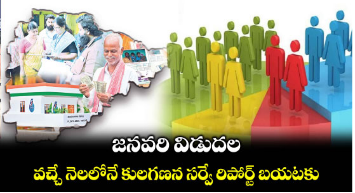
జనవరి విడుదల వచ్చే నెలలోనే కులగణన సర్వే రిపోర్ట్ బయటకు

వస్తే జాబ్ క్యాలెండర్ ప్రకారం కొత్తగా నోటిఫికేషన్లు వచ్చే అవకాశం ఉన్నందున రిక్రూట్మెంట్ ఏజెన్సీలు రెడీగా ఉన్నాయి. వీటితోపాటు రైతు భరోసా, కొత్త రేషన్ కార్డులు, ఇందిరమ్మ ఇండ్ల మొదటి విడత లబ్ధిదారులను ఎంపిక చేసి.. ఇండ్లకు ముగ్గు పోయడం వంటి ముఖ్యమైన నిర్ణయాలన్నీ జనవరి నెలలో ఉండడం ప్రాధాన్యత సంతరించుకున్నది. కుల గణన, ఎస్సీ వర్గీకరణ రిపోర్ట్ సిద్ధం! : కుల గణన సర్వేలో భాగంగా రాష్ట్రంలో ఉన్న ఇండ్ల నుంచి దాదాపు 97 శాతం మేర వివరాలు సేకరించినట్లు తెలిసింది. ఈ డేటా మొత్తం డిజిటలైజేషన్