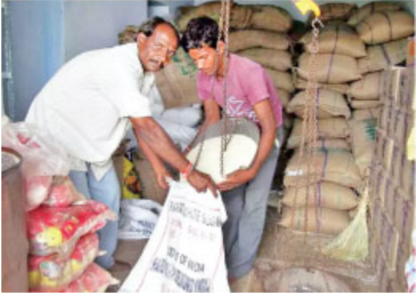
లేకపోవడమూ యధేచ్ఛగా సాగుతున్న దండా తీరుకు నిదర్శనం.

హైదరాబాద్ : ప్రజా పంపిణీ బియ్యం పక్కాదారి పడుతున్నాయి. రేషన్ దుకాణాలకు చేరిన కొద్దిరోజుల్లోనే అక్రమార్కుల గోదాముల్లోకి చేరుతున్నాయి. టన్నుల కొద్దీ బియ్యం ఇతర రాష్ట్రాలకు తరలిపోతున్నా.. కట్టడిలో మాత్రం ప్రభుత్వ విభాగాలు విఫలమవుతున్నాయి. రాజేంద్రనగర్, అమీర్పేట్, ఎల్వీనగర్, నాగోల్, అల్వాల్, పాతనగరం కేంద్రంగా దండా సాగుతోందని.. ఎక్కువ సంఖ్యలో గోదాముల నిల్వలు ఇక్కడే ఉన్నాయని ఇటీవల పట్టుబడిన ఉదంతాలతో స్పష్టమవుతోంది. రాజధాని పరిధిలోని ఆయా ప్రాంతాల్లో మొత్తం 634 కేసులు నమోదయ్యాయంటే పరిస్థితి ఎలా ఉందో అర్థం చేసుకోవచ్చు. గతేడాది, ఈ ఏడాది నమోదైన కేసుల్లోనూ పెద్దగా వ్యత్యాసం