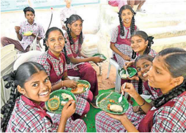
ఉదయమే ఆకలితో వస్తారు..

హైదరాబాద్: రాజధానిలో ప్రభుత్వ పాఠశాలల్లో చదువుకుంటున్న విద్యార్థులందరికీ అల్పహారం అందించేందుకు గత ప్రభుత్వం చేపట్టిన పథకం నిలిచిపోయింది. ఈ ఏడాది జూన్ విద్యా సంవత్సరం ప్రారంభమై ఐదునెలలు పూర్తైనా ఇప్పటి వరకు విద్యార్థులు అధికారులు స్పందించడం లేదు. హైదరాబాద్, రంగారెడ్డి, మేడ్చల్ జిల్లాల్లోని ప్రభుత్వ పాఠశాలల్లో గతంలో విద్యార్థులకు పాఠశాలలోనే 2500 పైగా ప్రభుత్వ ప్రాథమిక, ప్రాథమికోన్నత, ఉన్నత పాఠశాలల్లో విద్యార్థులకు అల్పహారం అందడం లేదు. పదో తరగతి విద్యార్థుల ఉత్తీర్ణతను పెంచేందుకు డిసెంబరు తొలివారం నుంచి ప్రత్యేక తరగతులను ఆయా పాఠశాలల ఉపాధ్యాయులు ప్రారంభించారు. వీటికి హాజరయ్యే విద్యార్థులకు గతంలో చిరుతిళ్లు అందజేయగా ప్రస్తుతం ఆ ప్రస్తావనే లేదు. విద్యార్థులు అధికారులను ఆడగా.. బడ్జెట్ కేటాయింపుల ఇంకా రాలేదని, వస్తే అమలు చేస్తామంటున్నారు. ఉదయం, సాయంత్రం తరగతులకు హాజరవుతున్న పదోతరగతి విద్యార్థులకు కొన్ని పాఠశాలల్లో ఉపాధ్యాయులు, స్వచ్ఛంద సేవనంస్థల ప్రతినిధులు చిరుతిళ్లను పంపిణీ చేస్తున్నారు.