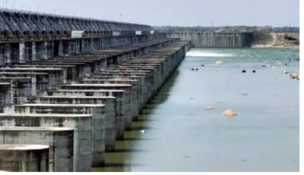
కాశీశ్వరం ప్రాజెక్టు పనుల రికార్డులు స్వాగతం..