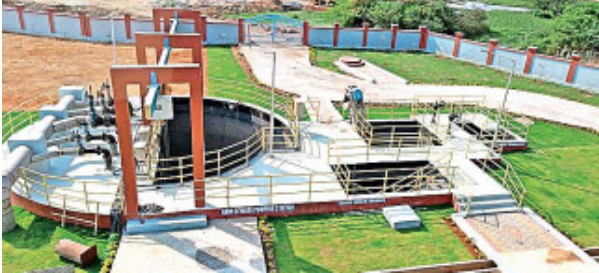
మురుగునీటిని శుద్ధి చేసే..

వైవేలు పరిశ్రమలకు.. సిద్దిపేట హౌసింగ్ డోర్లు కాలనీ, పట్టణ శివారులో పొడి వ్యర్థాల వనరుల సేకరణ కేంద్రాలు (డిఆర్సీసీ) నిర్వహిస్తున్నారు. గృహ, వాణిజ్య సముదాయాల నుంచి వెలువడే పొడి వ్యర్థాలను సేకరించి వివిధ ప్రాంతాలకు చెందిన రీసైకింగ్ యూనిట్లకు తరలిస్తున్నారు. కవర్లు, కాగితాలు, అట్టముక్కలు వైవేలు పరిశ్రమలకు విక్రయిస్తున్నారు. వాటితో పైల్స్, ఎగ్ గ్రేలు తయారు చేస్తున్నారు. పొడి చెత్తతో ప్రతి నెలా రూ. 11.15 లక్షలు సమకూరుతోంది.