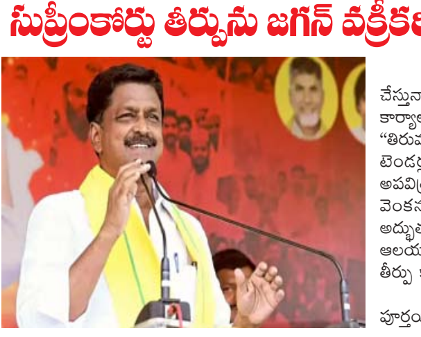
అమరావతి, అక్టోబర్ 4: బాపట్ల మాజీ ఎంపీ సందిగం సురేష్ కు హైకోర్టులో ఊరట లభించింది. టీడీపీ కేంద్ర కార్యాలయంపై జరిగిన దాడి కోసం బాపట్ల మాజీ ఎంపీకి హైకోర్టు ధర్మాసనం బెయిల్ మంజూరు చేసింది. సురేష్ షరతులతో కూడిన బెయిల్ను హైకోర్టు మంజూరు చేసింది. అయితే మాజీ ఎంపీ సురేష్పై ఉన్న హత్య కేసుపై తుళ్లూరు పోలీసులు పీటీ వారంట్ను దాఖలు చేశారు. తుళ్లూరు పోలీసులు వేసిన పీటీ వారంట్కు ట్రయల్ కోర్టు అనుమతించింది. కాగా.. టీడీపీ పార్టీ కార్యాలయంపై దాడి కేసుకు సంబంధించి గత నెలలో సందిగం సురేష్ హైదరాబాద్లో అరెస్ట్ అయిన విషయం తెలిసింది. ఈ దాడికి సంబంధించి కేసు నమోదు అయిన సేపట్లో కోర్టు రోజులుగా మాజీ ఎంపీ కోసం వెతికిన పోలీసులు చివరకు హైదరాబాద్లో అదుపులోకి తీసుకుని గుంటూరు జిల్లాకు తరలించారు.

క్రెస్టులపై ఊరకాత కోస్తే పవన్ ఎందుకు మాట్లాడరని వైఎస్ షర్మిల అడిగారు. ఇతర మతాల వారు ఓట్లు వేస్తే పవన్ గెలిచారనే విషయం గుర్తుంచుకోవాలని అన్నారు. ఇప్పుడు ఒకే మతం అంటున్న పవన్ను ఇతర మతాల వారు ఆదరిస్తారా అని వైఎస్ షర్మిల నిలదీశారు. కన్యాశుమారి నుంచి కాశ్మీర్ వరకు రాహుల్ గాంధీ యాక్ట్ చేశారని గుర్తు చేశారు. అటువంటి నేతను... పవన్ కళ్యాణ్ విమర్శిస్తున్నారని మండిపడ్డారు. ప్రధానమంత్రి సరేంద్రమోడి మాయ నుంచి పవన్ కళ్యాణ్ బయటకురావాలని వైఎస్ షర్మిల హితవు పలికారు. అమరావతి: జగన్ అబద్ధాలు చెప్పి ప్రజలను నమ్మించే ప్రయత్నం చేస్తున్నారని ఆధికమంత్రి పయ్యాల కేశవ్ మండిపడ్డారు. తెదేపా కేంద్ర కార్యాలయంలో ఏర్పాటు చేసిన మీడియా సమావేశంలో ఆయన మాట్లాడారు. "తిరుమల ప్రాశస్త్యం గురించి గతంలో ఎప్పుడైనా జగన్ మాట్లాడారా? నెయ్యి బెండర్ల విధానాన్ని సర్వనాశనం చేశారు. వైకాపా పాలనలో తిరుమల అపవిత్రమైంది. డిక్రీషన్ ఇవ్వాలి వస్తుందని కొండకు వెళ్లిన వ్యక్తి జగన్. వెంకన్నను నమ్ముతున్నారని ఒక్కమాట కూడా చెప్పలేదు. తిరుమలలో అద్భుతమైన వ్యవస్థను కాపాడారా? తిరుమల వెళ్లినందుకు బద్దకించి ఇంట్లోనే ఆలయం సెట్ చేశారు. సుప్రీం ఆదేశాలను వక్రీకరించిన సమర్థుడు జగన్. తీర్పు కాపీ రాకముందే డ్రైనింగ్ పట్టి వక్రీకరించారు. జగన్ చెప్పేవన్నీ జనం నమ్ముతారనుకోవడం ఆయన శ్రమ. విచారణ పూర్తయితే దోషులు బయటకు వస్తారు" అని కేశవ్ అన్నారు.