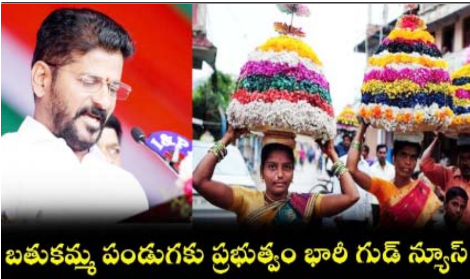
బతుకమ్మ పండుగకు ప్రభుత్వం భారీ గుడ్ న్యూస్

హైదరాబాద్ / అమరావతి : రాష్ట్రంలో ఎన్నోయే కుటుంబాలకు అధికారానికి రావడంతో టీడీపీకి మరింత ఊపునిచ్చింది. ఇదే ఒరవడితో తెలంగాణలోనూ పాగా వేయాలని సీఎం చంద్రబాబు భావిస్తున్నారు. భాషాపరంగా పార్టీ విస్తరణకు అవకాశం ఉన్నది కూడా అక్కడే. ప్రస్తుతం కేంద్ర సర్కారు ఏర్పాటు లో టీడీపీ కీలక పాత్ర పోషించిన