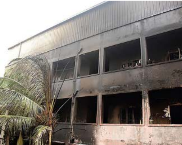
హైదరాబాద్: నిబంధనలకు విరుద్ధంగా గోదాములు నిర్వహిస్తున్న యజమానుల నిర్లక్ష్య వైఖరి వల్ల కార్మికులు బలవుతున్నారు.

హైదరాబాద్: నిబంధనలకు విరుద్ధంగా గోదాములు నిర్వహిస్తున్న యజమానుల నిర్లక్ష్య వైఖరి వల్ల కార్మికులు బలవుతున్నారు. కనీస రక్షణ చర్యలు తీసుకోకపోవడంతో ప్రమాదాలు చోటుచేసుకుంటున్నాయి. అగ్నికి ఆజ్యం పోసేలా రసాయన ద్రవ్యాలు, ఫర్నిచర్, ప్లాస్టిక్ గోదాములు నిర్వహిస్తున్నారు. నివాసాల మధ్య రసాయన ద్రవ్యాలను నిల్వ చేయడంతో నాంపల్లి బజార్‌లో ఘటనలో 9 మంది దుర్మరణం చెందారు. ఈ ఘటన మరవక ముందే జియోగ్రాఫిలోని ఫర్నిచర్ గోదాములో మంటలంటుకొని ఓ కుటుంబం చిన్నాభిన్నమైంది. తర్వాత జరిగిన అగ్నిప్రమాద ఘటనలో అంబి, కూతురు మరణించారు. తల్లి, చిన్నకుమార్తె పరిస్థితి విషమంగా ఉంది. ఇంత జరుగుతున్నా అధికారులు తనిఖీలు చేసి ఇలాంటి గోదాములపై కఠిన చర్యలు తీసుకోకపోవడం గమనార్వం. నాంపల్లిలో ఏ గర్భి చూసినా.. నాంపల్లిలో ఎటు చూసినా నివాసాల మధ్య రసాయన, ప్లాస్టిక్ గోదాములు కనిపిస్తాయి. ఇటీవల బజార్‌లో ఘటన జరిగిన ప్రాంతం