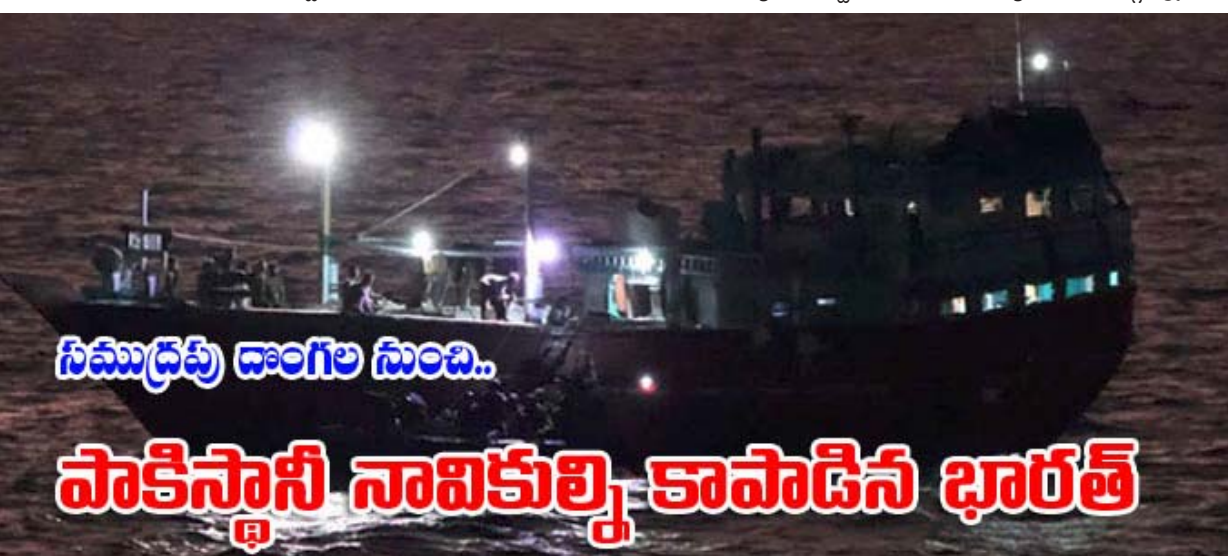
నిమిద్రపు దొంగల సుంబి.. పాకిస్థానీ నావికుల్ని కాపాడిన భారత్