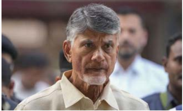
అమరావతి: విజయనగరం జిల్లాలో వరుస మరణాలపై తెదేపా అధినేత చంద్రబాబు విచారం వ్యక్తం చేశారు. శృంగవరపుకోట