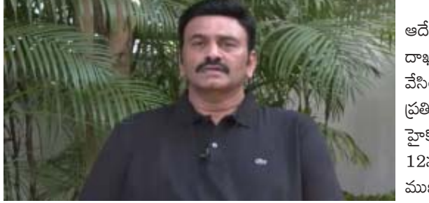
అమరావతి: వైసీపీ ప్రభుత్వ పాలసీలపై సీబీఐ విచారణకు ఆదేశించాలని కోరుతూ ఎంపీ రఘురామ కృష్ణరాజు ఏపీ హైకోర్టులో పిల్ దాఖలు చేశారు. దీనిపై విచారణను ఏపీ హైకోర్టు ఫిబ్రవరి 12కి వాయిదా వేసింది. ఈలోపు వ్యాజ్యం విచారణ అర్హతపై కొంటర్ దాఖలు చేసేందుకు ప్రతివాదులకు వెసులుబాటు కలిగింది. కొంటర్లపై రిపై వేయాలని పిటిషనరుకు హైకోర్టు ఆదేశాలు జారీ చేయడం జరిగింది. పిల్ విచారణార్హతపై ఫిబ్రవరి 12న వాదనలు వింటామని స్పష్టం చేసింది. వ్యాజ్యం విచారణ అర్హతపై ముఖ్యమంత్రి జగన్ కొంటర్ దాఖలు చేయనున్నారు.