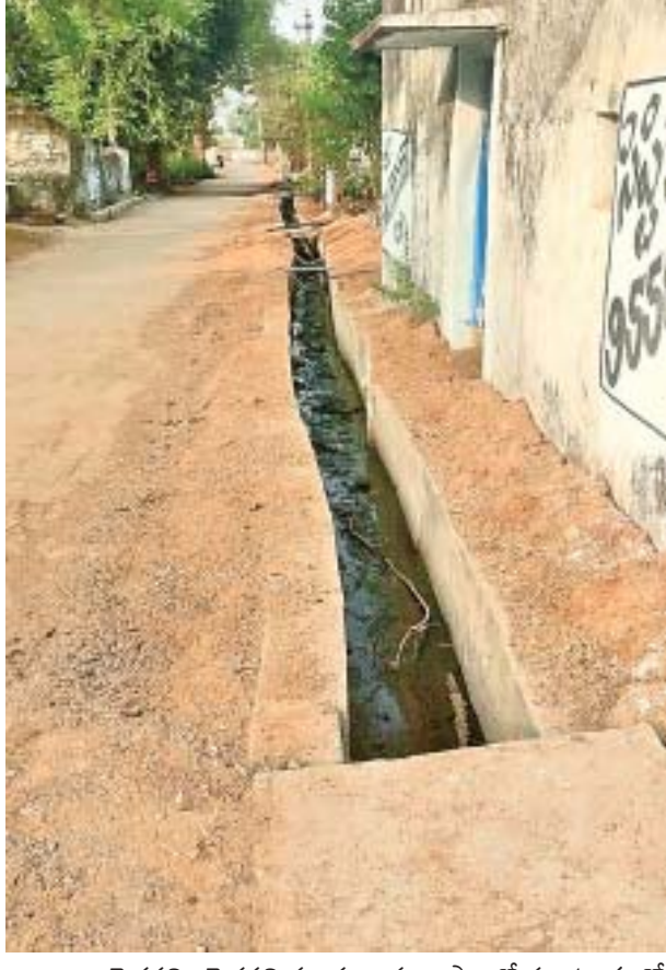
పెద్దపల్లి : పెద్దపల్లి మండలం మూలసాలలో రూ.4 లక్షలతో మురుగు కాలువ నిర్మించారు. ఆరు నెలలుగా బిల్లుల కోసం ఎదురు చూపులు తప్పడం లేదు.

సూర్యాపేట : పాఠశాల ఆవరణ ప్రశాంతంగా ఉండాలంటే చుట్టూ ప్రహరీ ఉండాలి.. అప్పుడే విద్యార్థులు చదువుపై దృష్టిపారినారు. జిల్లాలో చాలా ప్రభుత్వ బడులకు రక్షణ లేక పశువులు, పందులు సంచరిస్తూ విద్యార్థులను ఇబ్బందులకు గురి చేస్తున్నాయి. చాలా చోట్ల ఇదే పరిస్థితి ఉన్నా అధికారులు పట్టించుకోవడం లేదు. యాదాద్రి భువనగిరి జిల్లాలో 17 మండలాల్లో ఉన్నత, ప్రాథమికోన్నత, ప్రాథమిక పాఠశాలలు 712 ఉన్నాయి. వాటిలో 393 పాఠశాలలకు ప్రహరీలు లేక విద్యార్థులకు రక్షణ కరవైంది. ప్రభుత్వం సూత్రంగా పాఠశాలలకు నిర్మాణాలు చేపట్టినా నిధులు లేక మధ్యలోనే ఆగిపోయాయి. పిల్లలకు ఆహారం కూడా లభించడం లేదు. వాతావరణంలో విద్యన అందిస్తున్నామని ప్రభుత్వం చెబుతున్నా మాటలు నీటి మీద రాతలుగా మారాయి. ప్రహరీలు, వాచ్మెన్ లేకపోవడంతో బడి ఆవరణలు అసాంఘిక శక్తులకు అడ్డగా మారుతున్నాయి. రాత్రి వేళ మందుబాబులు మద్ద్యం తాగి సీసాలు అక్కడే పగలగొడుతున్నారు. సెలవు రోజుల్లో, రాత్రి వేళ్లలో గుర్తు తెలియని వ్యక్తులు మలమూత్ర విసర్జన చేయడంతో దుర్వాసన వస్తోందని విద్యార్థులు అనేకం వ్యక్తం చేస్తున్నారు. మరోవైపు శుభసకాలు, వానరాలు, పశువులు, పందులు పాఠశాల ఆవరణలో సంచరిస్తూ అపరిశుభ్రంగా మారుస్తున్నాయి. అక్కడ నాణ్యమైన మొక్కలు కూడా దక్కడం లేదు. ఇక రహదారి పక్కన ఉన్న పాఠశాలల్లో సమస్య తీవ్రంగా ఉంది. విరామ సమయంలో విద్యార్థులు ఆటలు ఆడుతూ రోడ్లపైకి వెళ్తుండటంతో ఏ కక్షణన ఏం జరుగుతుందోనని తల్లిదండ్రులు, ఉపాధ్యాయులు ఆందోళన చెందుతున్నారు. చుట్టూ గోడలు లేకపోవడంలో పాఠశాల స్థలం కూడా ఆక్రమణకు గురయ్యే అవకాశం ఉంది. ఇప్పటికైనా అధికారులు స్పందించి తగు చర్యలు చేపట్టాలని గ్రామస్థులు కోరుతున్నారు.