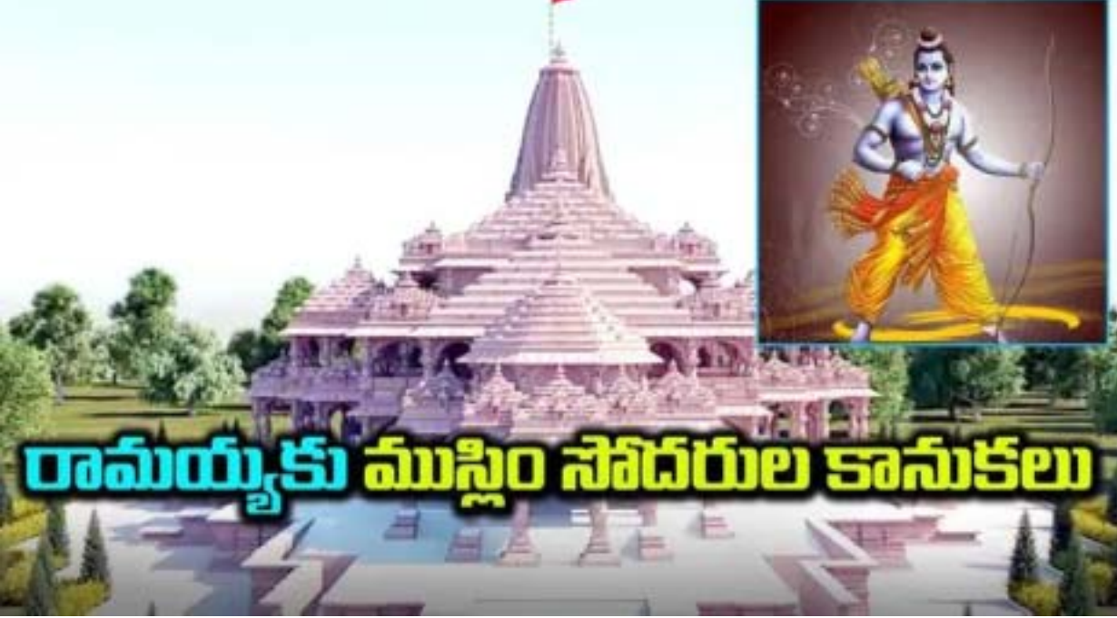
రామయ్యకు ముస్లిం సోదరుల కానుకలు