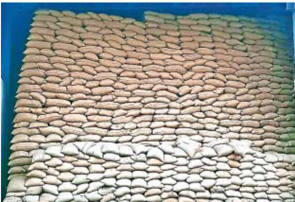
చూజూరాబాద్ : గత నెల 20న పౌర సరఫరాలశాఖ అధికారులు జగిత్యాల జిల్లాలో 30 మిల్లలను తనిఖీలు చేశారు. సుమారు లక్ష క్వింటాళ్ల ధాన్యం పక్కదారి పట్టించినట్లు గుర్తించి 26 మంది మిల్లర్లకు షోకాజ్ నోటీసులు జారీ చేశారు. మరో ఆరు మిల్లలను నిషేధిత జాబితాలో పెట్టారు. 38 మంది మిల్లర్లను డిస్బల్డ్ గుర్తించి వారికి రూ. 2.12 కోట్ల జరిమానా విధించారు.

గత నెల 28న ఎన్ఫోర్స్ మెంట్, టాస్ఫోర్స్ అధికారులు చూజూరాబాద్, జమ్మికుంట, ఇల్లందకుంటలోని ఆరు మిల్లలను తనిఖీ చేసి సుమారు రూ.52 కోట్ల విలువైన 2.66 లక్షల క్వింటాళ్ల ధాన్యం మాయం చేసినట్లు గుర్తించి నోటీసులు జారీ చేశారు. శంకరపట్నం మండలంలోని మొలంగూరులోని ఓ రైస్ మిల్లకు 38,893 క్వింటాళ్ల ధాన్యం కేటాయించగా 23,504 క్వింటాళ్ల ధాన్యం మాయమైపోయి అధికారులు గుర్తించి రూ. 7,18,26,515 జరిమానా చెల్లించాలని నోటీసులిచ్చారు. అయినా స్పందించక పోవడంతో మిల్లు నిర్వాహకుడిపై పలు సిక్స్ కింద కేసులు పెట్టి ఈ నెల 6న అరెస్ట్ చేసి రిమాండ్ కు పంపించారు. ఉమ్మడి జిల్లాలో ఇదే తొలి అరెస్ట్ కావడం గమనార్హం. ఈ నెల 6న జగిత్యాలలో పౌరసరఫరాల శాఖ అధికారులు, మిల్లు యజమానులతో సమావేశం నిర్వహించి ధాన్యం మాయం చేసిన మిల్లర్లను నిషేధిత జాబితాలో పెట్టి క్రిమినల్ కేసులు నమోదు చేస్తామని ఎన్ఫోర్స్ మెంట్, టాస్ఫోర్స్ ఓఎస్ఐ ఎం.ప్రభాకర్ హెచ్చరించారు. ధాన్యం లేకుండా బియ్యం ఇవ్వకండా జాప్యం చేసే వారి అస్సులు జప్తు చేస్తామన్నారు. ఈ నెల 31లోగా కచ్చితంగా