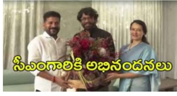
సీఎం గారికి అభినందనలు

తెలంగాణ సీఎం రేవంత్ రెడ్డిని కింగ్ నాగార్జున తన భార్య అమల అక్కినేనితో కలిసి మర్యాదపూర్వకంగా కలిశారు. జూబిలీహిల్స్ లోని సీఎం నివాసంలో నాగార్జున దంపతులు సీఎం రేవంత్ రెడ్డిని కలిశారు. దీనికి సంబంధించిన ఫోటోలు, వీడియో సెల్ఫీలు వైరల్ అవుతున్నాయి. రేవంత్ రెడ్డిని సీఎం ప్రకటించిన సమయంలో టాలీవుడ్ నుంచి ముందుగా చిరంజీవి అభినందనలు తెలపడంతో పాటు.. రీసెంట్ గా స్వయంగా తన ఇంటికి వెళ్లి ఆయనని అభినందించారు. మొగ్గలూరి చిరంజీవి తర్వాత రేవంత్ రెడ్డిని కింగ్ నాగార్జున ఇలా మర్యాదపూర్వకంగా కలిసి ఆయనకు అభినందనలు తెలియజేశారు.