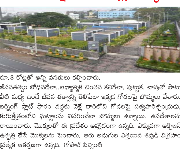
రూ. 3 కోట్లతో అన్ని వనతులు కల్పించారు. జీవనతత్వం బోధపడేలా.. ఆధ్యాత్మిక చింతన కలిగేలా, పుట్టుక, చావుతో పాటు వీటి మధ్య ఉండే జీవన తత్వాన్ని తెలిపేలా ఇక్కడ గోడపై బొమ్మలు వేశారు. బల్బింగ్ ఫ్లాట్ ఫాం వద్దకు వెళ్లే దారిలోని గోడపై సత్యహరిశ్చంద్రుడు, కురుక్షేత్రంలోని ఘట్టాలను వివరించేలా బొమ్మలు ఉన్నాయి. ఉపదేశాలను రాయించారు. మొక్కజొన్న ఈ ప్రదేశం ఆహ్లాదంగా ఉన్నది. ఎక్కువగా ఆక్సీజన్ ఉత్పత్తి చేసే మొక్కలను పెంచారు. ఆరు అడుగుల ఎత్తయిన శివుడి విగ్రహం ప్రత్యేక ఆకర్షణగా ఉన్నది. గోపాతే ప్సింగ్

వరంగల్ : చారిత్రక వరంగల్ నగరం సరికొత్తగా మారుతున్నది. రాష్ట్ర ప్రభుత్వం ప్రణాళికాబద్ధంగా చేస్తున్న అభివృద్ధి పనులతో అన్ని వనతులను సమకూర్చుకుంటున్నది. రోజూ తాగునీటి సరఫరా, మెరుగైన రవాణా కోసం రోడ్ల విస్తరణ, మురుగునీటి పారుదల వ్యవస్థ, సమీకృత మార్కెట్లు, ఆహ్లాదం పంచే పార్కులతోపాటు వైకుంఠధామాలను నిర్మిస్తున్నారు. వరంగల్ పశ్చిమ నియోజకవర్గంలోని 57వ డివిజన్లో రాష్ట్రంలోనే మోడల్ వైకుంఠధామం నిర్మించింది. నగరాల్లోని కిరాయి ఉండేవారి ఇండ్లల్లో ఎవరైనా కాలం చేస్తే ఇంటి యజమానుల నుంచి అవమానాలు ఎదురయ్యేవి. ఇక ఆ బాధలు తప్పాయి. ఇలాంటి వారి కోసం ప్రత్యేకంగా గదులను నిర్మించారు. అస్థికలు భద్రపరిచేందుకు లాకర్లు, వ్యూతడిహోల ఖననం కోసం నాలుగు బల్బింగ్ ఫ్లాట్ ఫాంలను నిర్మించారు. దహన సంస్కారాలకు వచ్చేవారు ఆక్రమ నిల్వనీడకు పీలగా బల్బింగ్ ఫ్లాట్ ఫాంకు ఎదురుగా వచ్చినకు ఏర్పాటు చేస్తున్నారు. మహిళలకు, పురుషులకు ప్రత్యేకంగా గదులు ఉన్నాయి. కర్మకాండలు చేసుకునే పెద్ద హోటల్, రెండు గదుల భవనాన్ని నిర్మించారు. అస్థికలు భద్రపరిచేందుకు లాకర్లు, నిర్వహణ కోసం ఆసీను ఉన్నది. రెండున్నర ఎకరాల విస్తీర్ణంలో విశాలంగా దీన్ని నిర్మించారు.