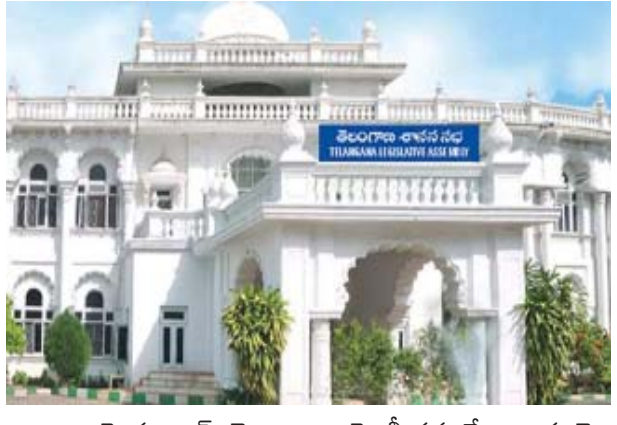
హైదరాబాద్: తెలంగాణ అసెంబ్లీ సమావేశాలు ఈ నెల 14కు వాయిదా పడ్డాయి. వుసాప్రారంభమైన తొలిరోజున శాసన సభాపతిని ఎన్నుకుంటారు. ఆ మరుసటి రోజు ఉభయ సభలను ఉద్దేశించి గవర్నర్ తమిళిసై ప్రసంగిస్తారు. తర్వాతి రోజు గవర్నర్ ప్రసంగానికి ధన్యవాదాలు తెలిపే తీర్మానాన్ని ప్రవేశపెట్టి చర్చిస్తారు. ఆ తర్వాత ఎన్ని రోజులు సభ నిర్వహించాలనేది స్వీకర్ ఎన్నిక అనంతరం జరిగే బీసీలో నిర్ణయిస్తారు. శనివారం ఉదయం 11 గంటలకు శాసనసభ సమావేశాలు ప్రారంభం కాగా.. కొత్తగా ఎన్నికైన ఎమ్మెల్యేలతో ప్రాటించి స్వీకర్తగా ఎంబిఎంకు చెందిన చాంద్రాయణగుట్ట ఎమ్మెల్యే అక్బరుద్దీన్ ఒవైసీ ప్రమాణం చేయించారు. ముందుగా ముఖ్యమంత్రి రేవంత్ రెడ్డి, తర్వాత ఉపముఖ్యమంత్రి భట్టి విక్రమార్కు, ఆ తర్వాత వరుసగా మంత్రులు, ఎమ్మెల్యేలు ప్రమాణం చేశారు. మాజీ సీఎం కేసీఆర్ కు సర్దర్ దృష్ట్యా ప్రమాణ స్వీకారానికి కేటీఆర్ రాలేదు. ప్రమాణ స్వీకారానికి తనకు మరో రోజు సమయం ఇవ్వాలని శాసనసభ సెక్రటరీని ఆయన కోరారు.

సభాపతిని ఎన్నుకుంటారు. ఆ మరుసటి రోజు ఉభయ సభలను ఉద్దేశించి గవర్నర్ తమిళిసై ప్రసంగిస్తారు. తర్వాతి రోజు గవర్నర్ ప్రసంగానికి ధన్యవాదాలు తెలిపే తీర్మానాన్ని ప్రవేశపెట్టి చర్చిస్తారు. ఆ తర్వాత ఎన్ని రోజులు సభ నిర్వహించాలనేది స్వీకర్ ఎన్నిక అనంతరం జరిగే బీసీలో నిర్ణయిస్తారు. శనివారం ఉదయం 11 గంటలకు శాసనసభ సమావేశాలు ప్రారంభం కాగా.. కొత్తగా ఎన్నికైన ఎమ్మెల్యేలతో ప్రాటించి స్వీకర్తగా ఎంబిఎంకు చెందిన చాంద్రాయణగుట్ట ఎమ్మెల్యే అక్బరుద్దీన్ ఒవైసీ ప్రమాణం చేయించారు. ముందుగా ముఖ్యమంత్రి రేవంత్ రెడ్డి, తర్వాత ఉపముఖ్యమంత్రి భట్టి విక్రమార్కు, ఆ తర్వాత వరుసగా మంత్రులు, ఎమ్మెల్యేలు ప్రమాణం చేశారు. మాజీ సీఎం కేసీఆర్ కు సర్దర్ దృష్ట్యా ప్రమాణ స్వీకారానికి కేటీఆర్ రాలేదు. ప్రమాణ స్వీకారానికి తనకు మరో రోజు సమయం ఇవ్వాలని శాసనసభ సెక్రటరీని ఆయన కోరారు.