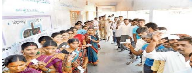
మినహా అందరూ ఓటిస్తే ఈ ఉప ఎన్నికల్లో అత్యధికంగా 98.34 శాతం పోలింగ్ జరిగిన గ్రామంగా రికార్డుకెక్కారు.

మినహా అందరూ ఓటిస్తే ఈ ఉప ఎన్నికల్లో అత్యధికంగా 98.34 శాతం పోలింగ్ జరిగిన గ్రామంగా రికార్డుకెక్కారు. ముసుగోడు మండలంలోని జక్కలివారిగూడెంలోనూ అంతే. 392 మంది ఓటుదారులకు పాల్గొని మినహా అందరూ ఓటింగ్లో పాల్గొని 98.21 శాతంతో రెండో స్థానంలో నిలిచారు.