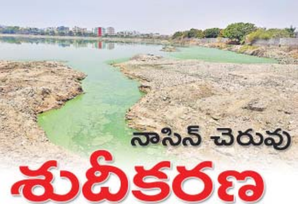
నాసిన్ చెరువు శుద్ధీకరణ

రంగారెడ్డి : : చెరువుల శుద్ధీకరణకు పూనుకుంది దమ్మాయి గూడ మున్సిపల్ పాలకవర్గం. మురుగునీటితో నిండిన చెరువులను స్వచ్ఛంగా తీర్చిదిద్దే దిశగా అడుగులు వేస్తోంది. దమ్మాయిగూడ మున్సిపల్ పరిధిలో నాసిన్ చెరువు, కోపులకుంట, కుమ్మరికుంట జలాశయాలున్నాయి. దాదాపు 30ఏళ్ల క్రితం వరకు ఆ చెరువుల చుట్టూ ఆయకట్టును ఆ నీటితోనే సాగు చేశారు. పశువుల దుమ్మక తీర్చేందుకు ఆ నీటినే వినియోగించేవారు. ఆ చెరువుల్లో పెంచిన చేపలను విక్రయించి మత్స్యకారులు జీవనోపాధి పొందారు. కాగా కాల క్రమేణ దమ్మాయిగూడ నగరానికి చేరువలో ఉండటంతో పెద్దఎత్తున జనాలు ఇక్కడికి వలస వచ్చారు. ఈ తరుణంలో చెరువు పరివాహక ప్రాంతంలో అదే స్థాయిలో కాలునీలు వెలిశాయి. ఈ క్రమంలో ఇళ్ల నుంచి వెలువడిన వ్యర్జాలు చెరువులోకి చేరడంతో మురుగుకూపంగా మారింది. ఆ ప్రాంతమంతా దుర్గంధం వెదజల్లుతోంది. దీనికి తోడు పక్కనే జవహర్ నగర్ డంపింగ్ యార్డు ఉండటంతో పరిస్థితి మరింత దయనీయంగా మారింది. దోవల స్వైరవిహారంతో జనాలు తరచూ అంటు వ్యాధులబారిన పడుతున్నారు. ఈ క్రమంలో చెరువును శుద్ధీచేసేందుకు మున్సిపల్ పాలక వర్గం