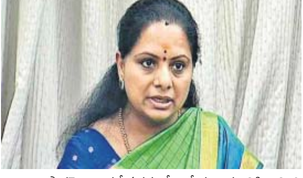
పార్లమెంటు ప్రత్యేక సమావేశాల్లో చర్చించడానికి తొమ్మిది

అంశాలను ప్రతిపాదన ప్రధాని నరేంద్ర మోదీకి కాంగ్రెస్ పార్లమెంటు పార్టీ చైర్మన్ సోనియా గాంధీ రాసిన లేఖలో మహిళా రిజర్వేషన్ బిల్లు అంశం లేకపోవడాన్ని ఎమ్మెల్యే కల్వకుంట్ల కల్వకుంట్ల కవిత తీవ్రంగా తప్పుపట్టారు. ప్రధానికి రాసిన లేఖలో మహిళా రిజర్వేషన్ బిల్లు గురించి ఎందుకు ప్రస్తావించలేదని సోనియా గాంధీని ట్విట్టర్ వేదికగా కవిత సూటిగా ప్రశ్నించారు. చట్టసభల్లో మహిళల ప్రాతినిధ్యం జాతీయ ప్రాముఖ్యత కలిగిన అంశం కాదా? అంటూ ప్రశ్నించారు. మహిళా బిల్లును కాంగ్రెస్ పార్టీని విస్తరిస్తున్నట్లు తేలుతెలుస్తుందని విమర్శించారు. చట్టసభల్లో మహిళలకు రిజర్వేషన్ కల్పించే ముఖ్యమైన మహిళా బిల్లుపై కాంగ్రెస్ పార్టీకి చిత్తశుద్ధి లేదని నిరూపించేవరకు సస్పెన్షన్ చేశారు.