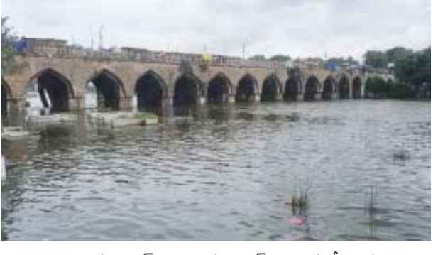
హైదరాబాద్ : హైదరాబాద్ శివార్లలో ఉన్న జంట జలాశయాలు ఉస్మాన్ సాగర్, హిమాయత్ సాగర్ గేట్లను ఎత్తి దిగువకు నీటిని విడుదల చేయడంతో మూసీ నదికి వరద ప్రమాదం పెరిగింది.

దీంతో పురానాపూల్ వద్ద మూసీ నది ఉద్ధృతంగా ప్రవహిస్తోంది. పురానాపూల్ నుంచి లంగర్ హౌస్ వల్లే వంద ఫీట్ల రోడ్డుపైకి భారీగా వరద నీరు వచ్చి చేరింది. మూసీ వరద ఉద్ధృతితో వంద ఫీట్ల రోడ్డుపై అధికారులు రాకపోకలు నిలిపివేశారు. ఆ రహదారి వైపునకు వాహనాలకు అనుమతించడం లేదు. మూసీ పరివాహ ప్రాంత ప్రజలను కూడా అధికారులు అప్రమత్తం చేశారు. హిమాయత్ సాగర్ కు 4 వేల క్యూసెక్కుల వరద నీరు వచ్చి చేరుతుండగా, 6 గేట్లు ఎత్తారు. మూసీలోకి 4,120 క్యూసెక్కుల నీటిని విడుదల చేశారు. హిమాయత్ సాగర్ ప్రస్తుత, పూర్తి నీటిమట్టం 1763.50 అడుగులుగా ఉంది. ఉస్మాన్ సాగర్ జలాశయం ఇన్ ఫ్లో 2,200 క్యూసెక్కులుగా ఉంది. ఉస్మాన్ సాగర్ ప్రస్తుత నీటిమట్టం 1789.90 అడుగులు కాగా, పూర్తిస్థాయి నీటిమట్టం 1790 అడుగులుగా ఉంది. ఈ జలాశయం 6 గేట్లు ఎత్తి మూసీలోకి 2,028 క్యూసెక్కుల నీటిని విడుదల చేశారు.