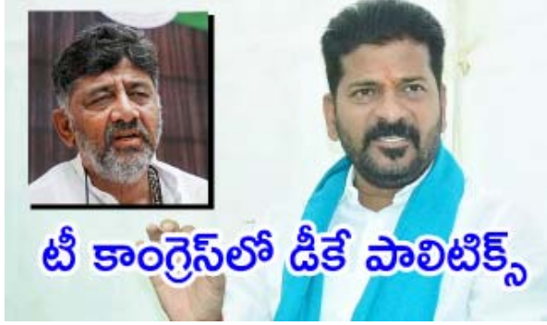
టీ కాంగ్రెస్ లో డీకే పాలిటిక్స్

అడుగులు వేయాలని ప్రధాని మోడీ భావిస్తున్నారు. అయితే.. ఒకేసారి ఎన్నికల్ని నిర్వహించేందుకు అన్ని పార్టీల మధ్య అవసరం. దీంతో పాటు రాజ్యాంగానికి.. ప్రజాప్రాతినిధ్య చట్టానికి సవరణలు చేయాలి. వీటితో పాటు భారీ స్థాయిలో కేంద్ర పోలీసు బలగాలు.. ఈవీఎం.. వీవీ ప్యాన్లు అవసరం అవుతాయి. వాటి తయారీకి భారీగా నిధులు అవసరమవుతాయి. ఇవన్నీ చేసేందుకు కనీసం ఏడాది నుంచి రెండేళ్లు అవసరమవుతాయి. ఇప్పుడున్న పరిస్థితుల్లో దేశ వ్యాప్తంగా 25 లక్షల లోపు ఈవీఎంలు ఉన్నాయి. కానీ.. ఒకేసారి ఎన్నికలు నిర్వహించాలంటే కనీసం 40 లక్షల ఈవీఎంలు అవసరం అవుతాయి. మరి.. అన్ని తయారు చేయాలంటే భారీ బడ్జెట్ అవసరమవుతుంది. ఇలా ప్రాక్టికల్ ప్రాబ్లమ్స్ ఉన్న నేపథ్యంలో జమిలి ఎన్నికలు ఇప్పటికిప్పుడు సాధ్యం కాదంటున్నారు. లేదంటే.. మిని జమిలి ఎన్నికలు జరిపి.. ఎన్నికలు నిర్వహించని రాష్ట్రాలను ఏకం చేసి.. వాటికి సవరణలు ఎన్నికలు నిర్వహించేలా చేయాల్సి ఉంటుంది. కానీ.. ఆ ప్రక్రియకు రాజకీయ పార్టీలు సానుకూలంగా స్పందిస్తాయా? అన్నది మరో ప్రశ్న. మొత్తంగా ఒక దేశం.. ఒక ఎన్నిక అన్న నినాదం.. మాట చెప్పినంత ఈజీ కాదని మాత్రం చెప్పక తప్పదు.