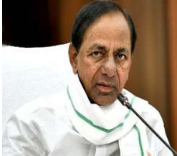
హైదరాబాద్ : ఒక గీతను చెరపకుండా చిన్నది చేయాలంటే ఏమిచేయాలి ? సింపుల్.. దాని పక్కనే మరో పెద్ద గీత గీయాలి.