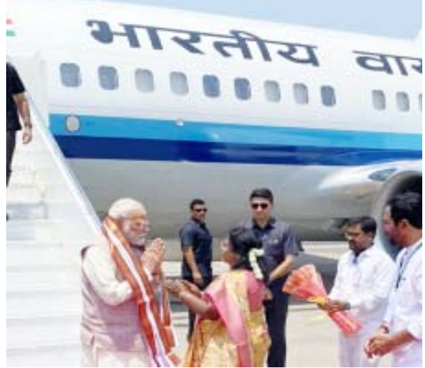
సికింద్రాబాద్ - తిరుపతి మధ్య నవవస్తు సెమీ హైస్పీడ్ వందేభారత్ ఎక్స్ ప్రెస్ ను ప్రధాని నరేంద్రమోదీ నేడు ప్రారంభించారు. ఈ నేపథ్యంలో హైదరాబాద్ కు చేరుకున్న ప్రధానికే గవర్నర్ తమిళిస్సై సౌందరరాజన్ స్వాగతం పలికారు.

కేటాయించాం. తెలంగాణలోనూ మెగా టెక్నాలజీ పార్క్ ఏర్పాటు చేశామన్నారు. పారిశ్రామిక అభివృద్ధి కోసం కృషి చేస్తున్నామని స్పష్టం చేశారు. తెలంగాణలో హైవే నెట్ వర్క్ ను విస్తరిస్తున్నాం. తెలంగాణలో 4 హైవేలైన్లకు శంకుస్థాపన చేశాం. రాష్ట్రంలో 5వేల కిలోమీటర్ల మేర జాతీయ రహదారుల నిర్మాణం జరిగిందన్నారు. తొమ్మిదేళ్లలో దేశం అన్ని రంగాల్లో అభివృద్ధి చెందింది. ఈజ్ ఆఫ్ డూయింగ్ లో? ముందంజలో ఉన్నాం. ప్రపంచంలో ఆర్థిక సంక్షోభం ఉన్నా భారత్ లో స్థిరంగా అభివృద్ధి జరుగుతోంది. మౌలిక సదుపాయాల అభివృద్ధికి ప్రాధాన్యతనిస్తున్నాం. ఇదే సమయంలో గత ప్రభుత్వాలపై తీవ్ర ఆరోపణలు చేశారు. విద్యార్థులు, రైతులు, చిరు వ్యాపారులకు నేరుగా నగదు జమ కోసం డిజిటల్ పేమెంట్ వ్యవస్థను ప్రోత్సహించాం. గతంలో ఇది ఎందుకు నిర్వహించలేదు? అని ప్రశ్నించారు.