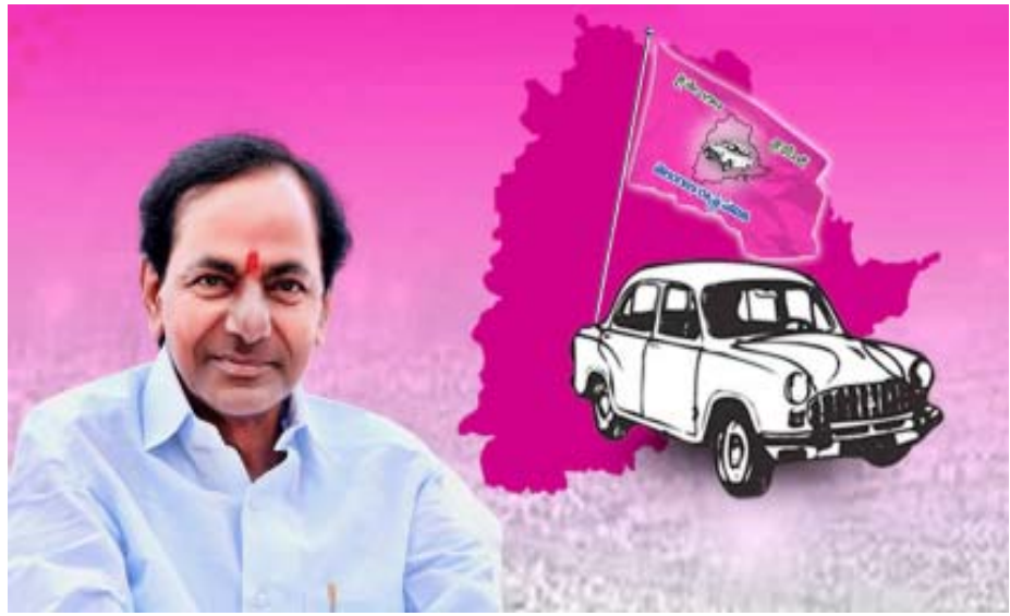
హైదరాబాద్ : తెలంగాణలో హ్యూటెక్ కొట్లాటని బీఆర్ఎస్ సెన్సే చేస్తోంది. రెండు పర్యాయాలు తమ ప్రభుత్వం ఎన్నో అభివృద్ధి కార్యక్రమాలను చేపట్టిందని చెబుతూనే.. మరీకొన్ని కొత్త స్కీలను అందుబాటులోకి తీసుకురావడానికి ప్లాన్ వేస్తున్నారు. మొత్తంగా అన్ని పర్యాయల ఆకట్టుకోవాలని చూస్తున్నారు. అయితే గత ఏమిదేళ్లుగా జాబ్ నోటిఫికేషన్లు లేకపోవడంతో బీఆర్ఎస్ పై యువత

పార్లమెంటులో ఉన్నా లేకున్నా దేశం కోసం పోరాడతా: రామారావు స్పాడిల్లీ: సూరత్ కోర్టు జైలు శిక్ష విధిస్తూ ఇచ్చిన తీర్పు, ఆ తర్వాత కొద్ది గంటలకే ప్రజా ప్రాతినిధ్య చట్టం సెక్షన్ 8 కింద తనపై అనర్హత వేటు వేస్తూ లోక్సభ సభ్యులకు సెక్షన్లు విధించడం చేయడంపై కాంగ్రెస్ మాజీ అధ్యక్షుడు రామారావు గాంధీ తొలిసారి స్పందించారు. "ఈ దేశం నాకు అన్నీ ఇచ్చింది. దేశం కోసం పోరాడతా" అని అన్నారు. తనను శాశ్వతంగా అనర్హుడిగా ప్రకటించినా, తన పని తాను చేసుకుంటానే పోతానని, పార్లమెంటులో ఉన్నా లేనా అనేది ప్రశ్న కాదని చెప్పారు. దేశం కోసం తాను పోరాటం సాగిస్తానే ఉంటానని చెప్పారు. ప్రధాని కళ్లలో భయం చూసా... అన్నానై తన తదుపరి ప్రసంగం ఎలా ఉంటుందోనని ప్రధానమంత్రికి భయం పట్టుకుందని, ఆ భయం ఆయన కళ్లలో తాను చూశానని ప్రధాని అన్నారు. అందువల్లే తొలుత తనపై వక్రీకరణలు చేశారని, ఇప్పుడు అనర్హత వేటు వేశారని ఆరోపించారు. నిజం మాట్లాడటం మినహా తనకు చేరేవాటిపై ఆసక్తి లేదని, నిజమే మాట్లాడతానని, తనపై అనర్హత వేటు వేసినా, అరెస్టు చేసినా నిజం కోసం పని చేస్తానని చెప్పారు. ఈ దేశం తనకు అన్నీ ఇచ్చిందని, దేశం కోసమే తాను పనిచేస్తానని అన్నారు. దేశ ప్రజాస్వామ్య స్వభావాన్ని, దేశ వ్యవస్థలను పరిరక్షించడమే తన పని అని, దేశంలోని పెద్ద ప్రజల గణానికి బాసటగా నిలబడటం, అదాని వంటి వ్యక్తులు ప్రధానితో తమకున్న సంబంధాలతో దేశాన్ని ఎలా వదిలిస్తున్నారో ప్రజల ముందుకు వెళ్లి వివరిస్తానని చెప్పారు.